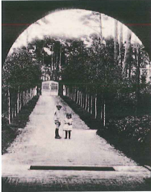
Die Birkenallee, 1920

Der große Innenhof war durch ein Holztor zu verschließen. Der ursprünglich im Zentrum vorgesehene Springbrunnen wurde nicht gebaut, auch die beiden Bäume, die den Hof begrünen sollten, wurden nicht gepflanzt. Die Wände des Hofes sollten berankt werden. 50