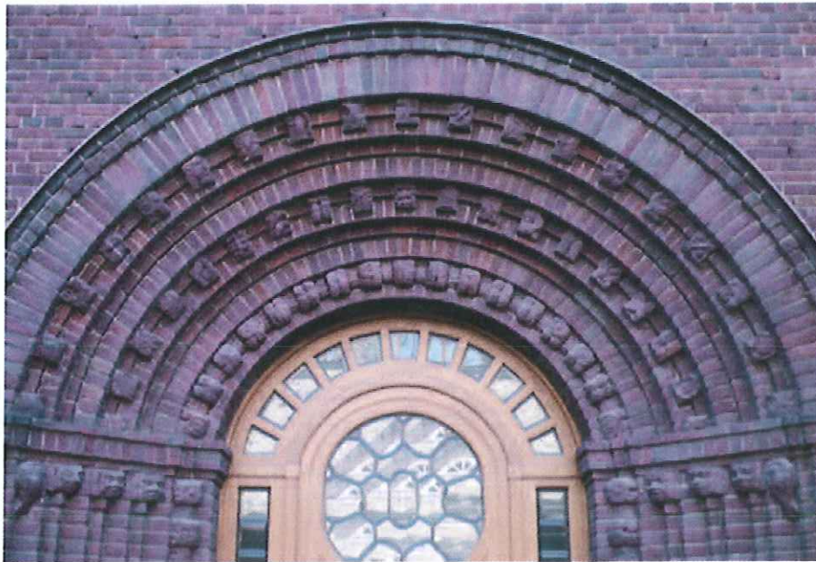
Ornamente über der Eingangstür des Mittelhofs

IIO /// GWZ BERLIN /// ZAS /// ZFL /// ZMO